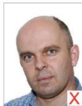
Effet de style

Le sujet doit présenter son visage face à l'objectif, sans incliner la tête de côté.