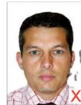
Traces / Pliures