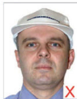
Port de casquette