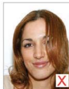
Visage non dégagé

Les yeux sont ouverts, le sujet fixant clairement l'objectif ; les cheveux ne doivent pas obscurcir les yeux.