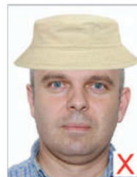
Port de chapeau