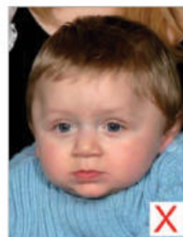
Autre personne présente

La photo doit représenter le sujet seul, sans dossier de fauteuil ou jouet visible par exemple. Le sujet doit regarder l'objectif en adoptant une expression neutre, bouche fermée.